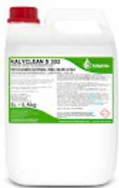
Kalyclean S 302 5L.jpg 608K