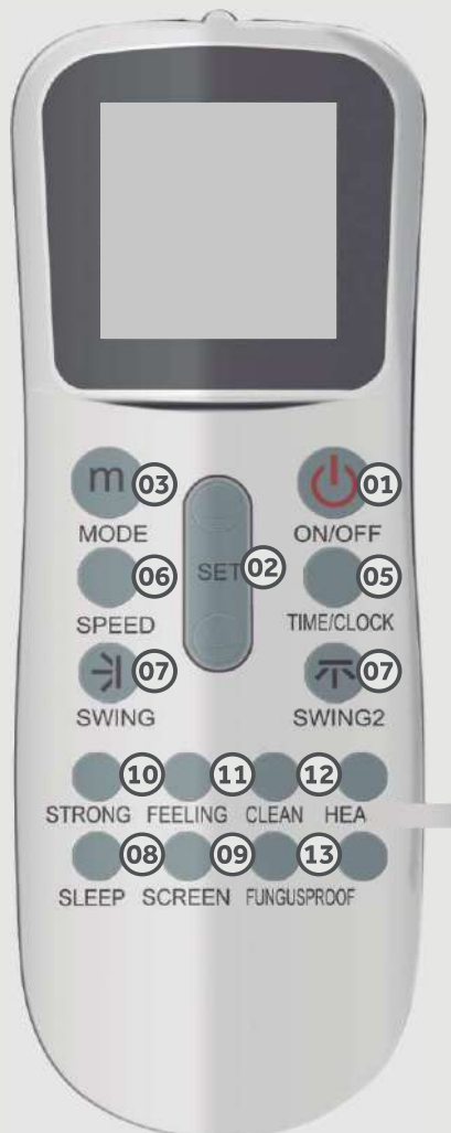
Controle Modelo NEO