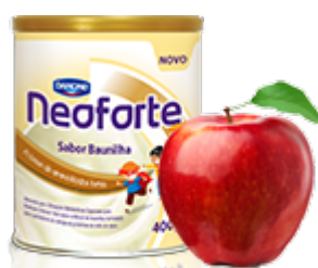
Neoforte com frutas

No caso de crianças alérgicas, em uso de fórmulas que substituem o leite, Neoforte pode ser acrescido ou substituir de uma a duas porções ao dia, sob orientação de médico e/ou nutricionista.