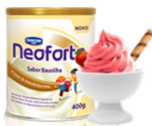
Neoforte nas receitas