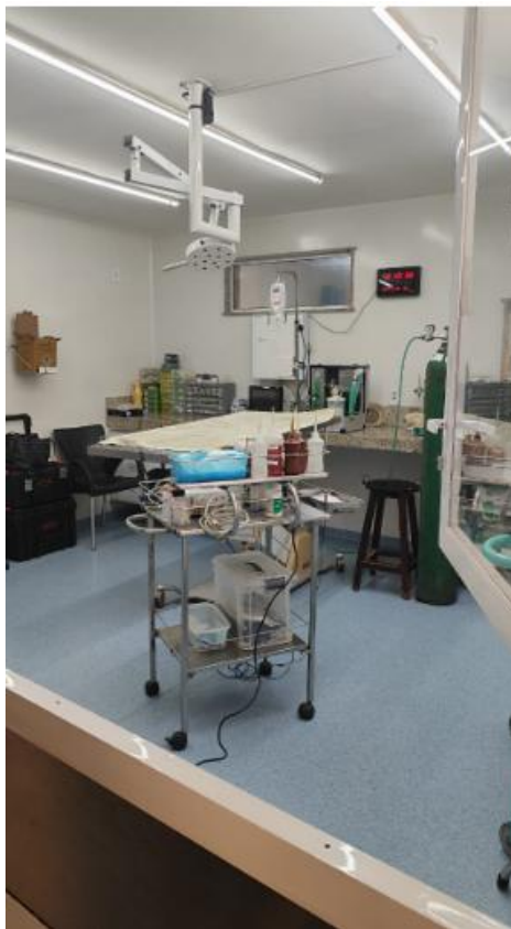
Centro Cirúrgico Completo