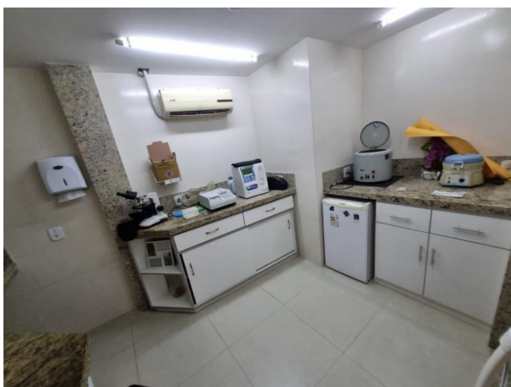
Laboratório Clínico Próprio